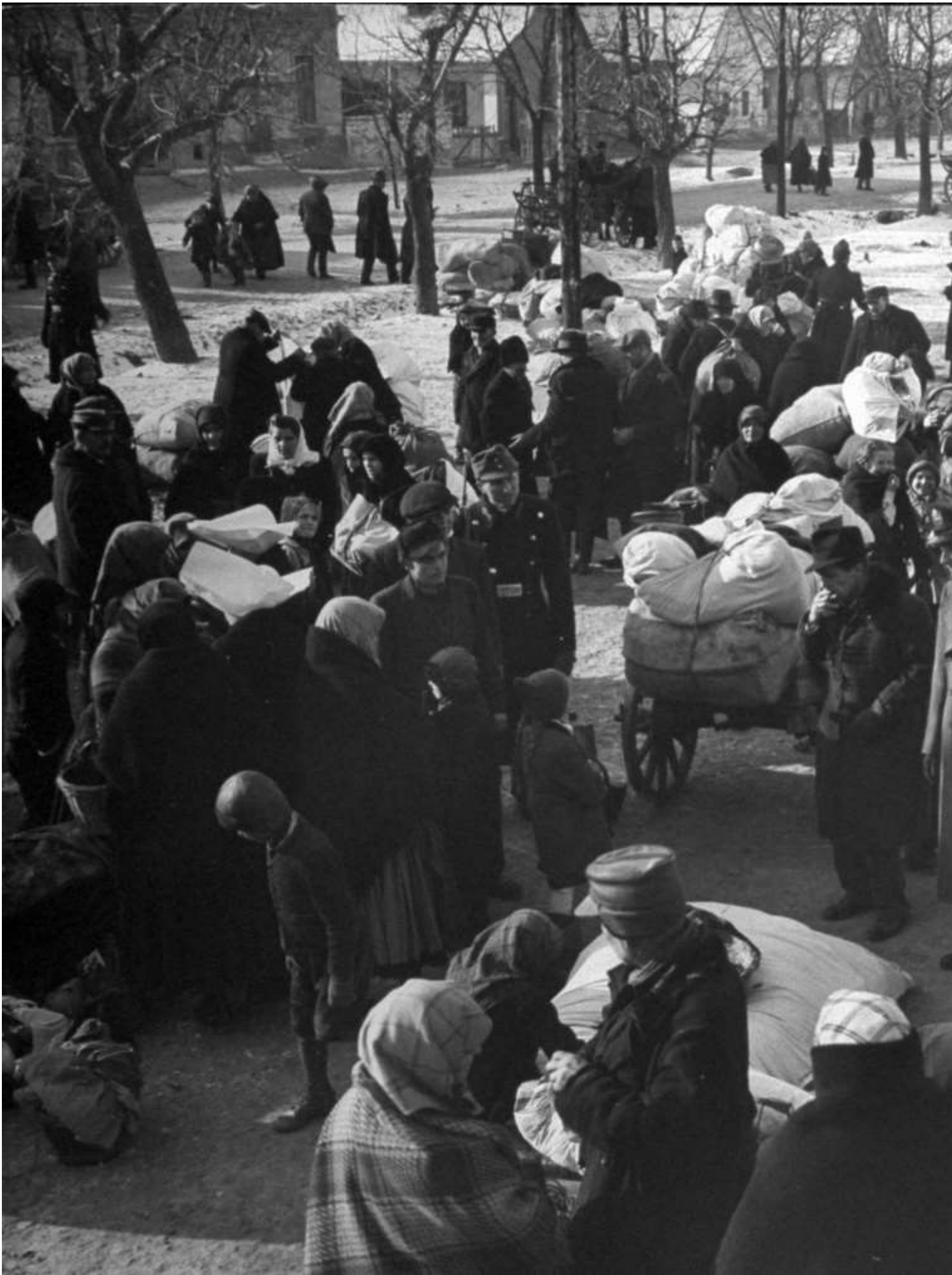
Kitelepítés előtt álló német családok Magyarországon, 1946-ban.